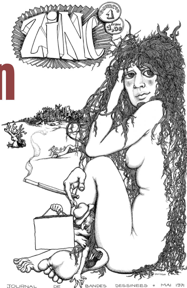
JOURNAL DE BANDES DESSINEES • MAI 1971